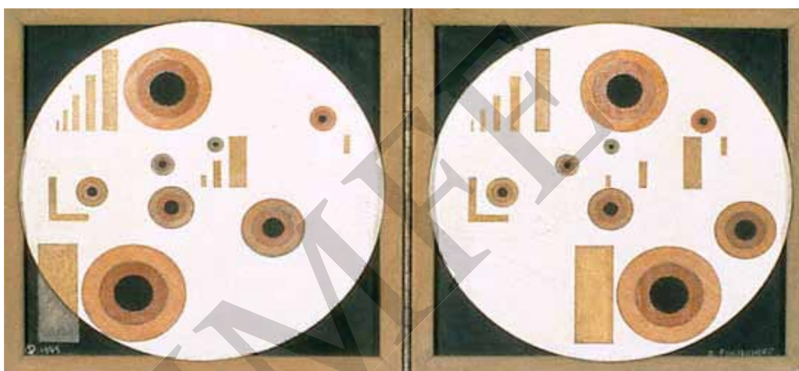
О. Фішінгер. Circles in Circle. Олія на мазоніті. 1949 р.

Стереоскопічні й моноскопічні картини О. Фішінгера розкривають спорідненість із подібними абстрактними роботами В. Кандинського, П. Мондріана, К. Малевича та російських конструктивістів [19].