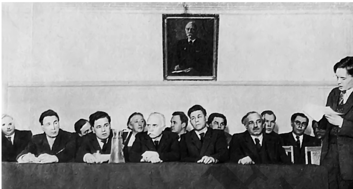
Авторський концерт Л. Ревуцького в Київському музичному училищі ім. Р. Глієра: Н. Шульман, В. Деряжний, П. Майборода, Л. Ревуцький, П. Сук, Б. Лятошинський. Виступає М. Кузьмін. 1949 р.

вав цю ділянку роботи. Загалом із 1960 по 1993 роки під його керівництвом було підготовлено й успішно захищено 48 кандидатських дисертацій, виконаних співробітниками відділу й прикріпленими до відділу музикознавства. Так, під науковим керівництвом Гордійчука було написано й успішно захищено кандидатську дисертацію В. Клина «Риси фортепіанного стилю Л. Ревуцького» (1978), а в кандидатській дисертації А. Поставної «Становлення творчого метода Л. Ревуцького в 20-і роки» Гордійчук виступав офіційним опонентом.