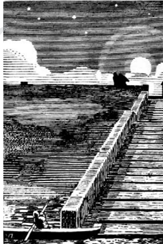
Буря. 1931 р.