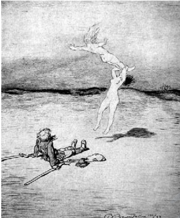
«Навождение». 1921 р.