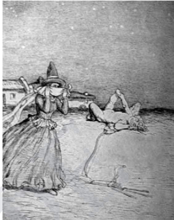
Купідон. 1921 р.