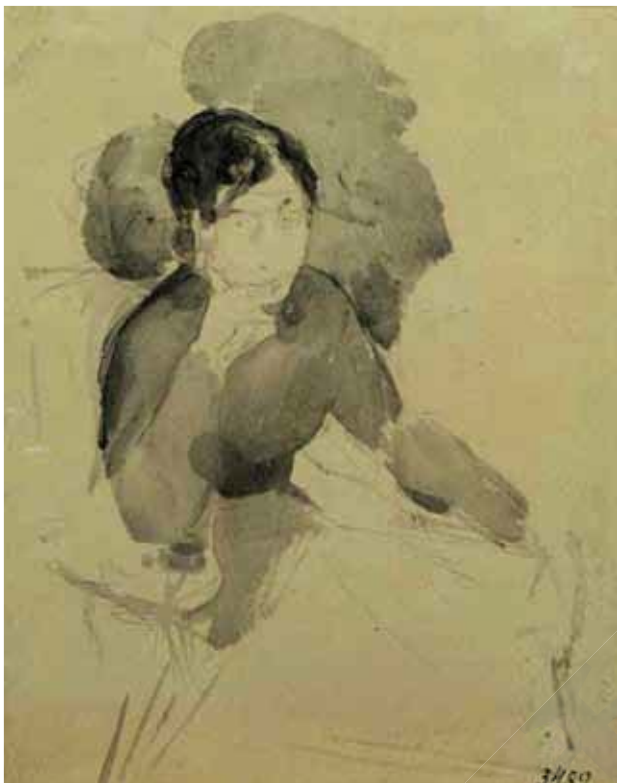
Михайло Врубель. Портрет молоді жінки *. 1885 р. Папір, чорна акварель