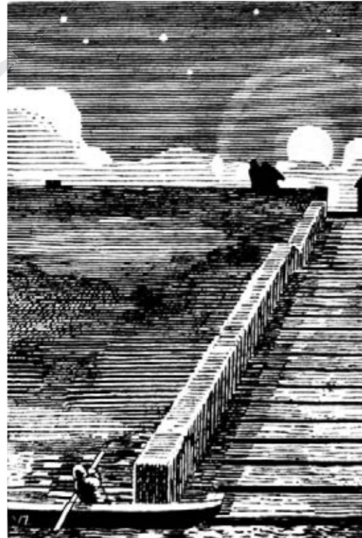
Буря. 1931 р.