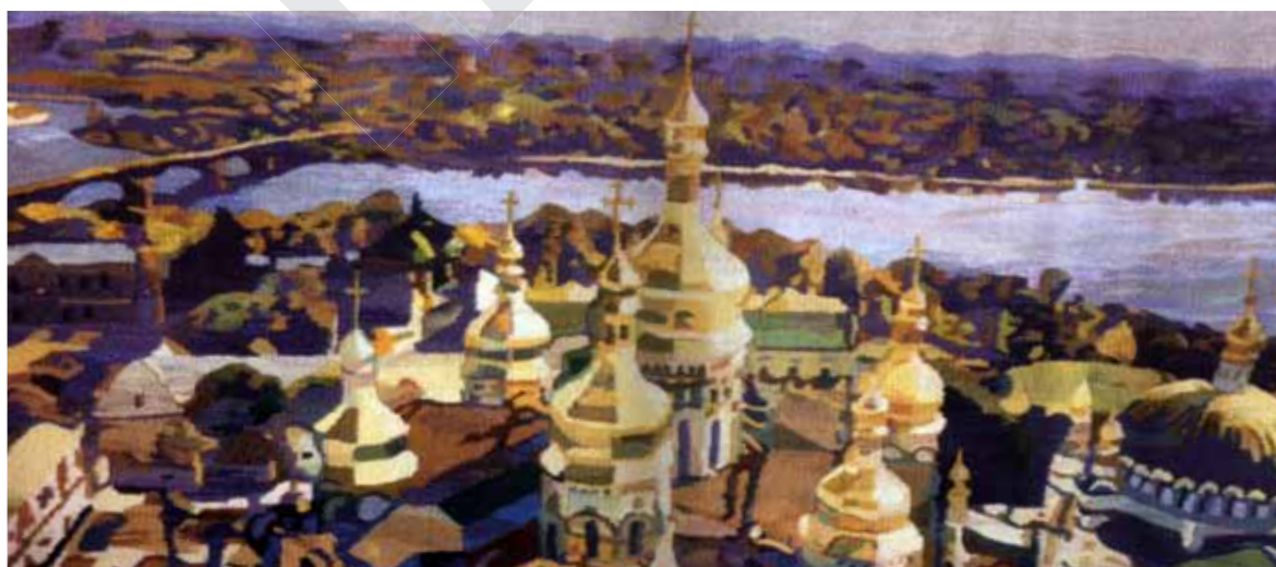
«Панорама з Лаврської дзвіниці». 2004 р.