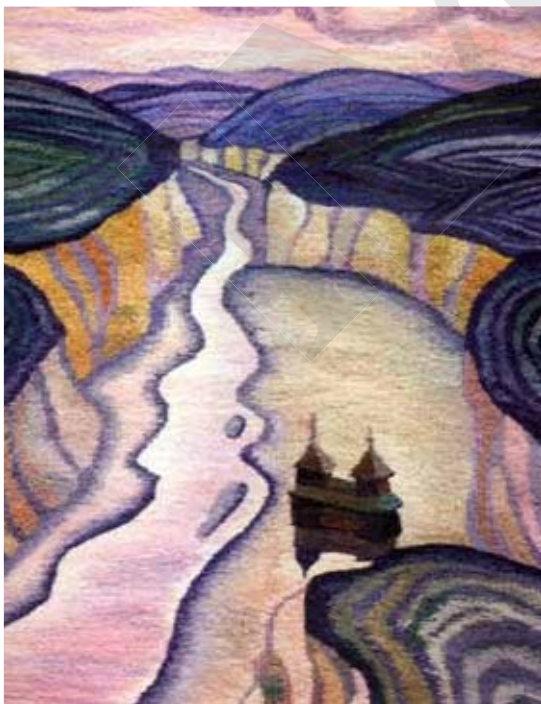
«Смотрич. Кам'янець-Подільський». 2002 р.