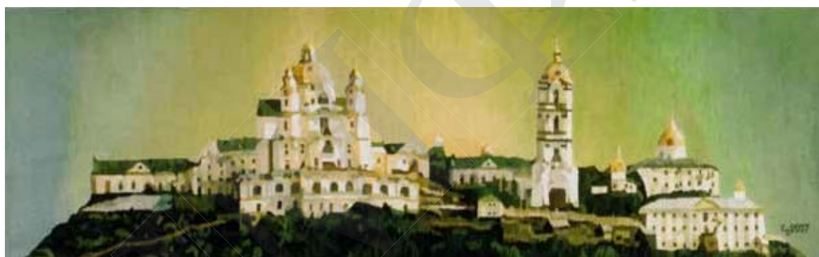
«Світанок. Почаївська лавра». 2007 р.