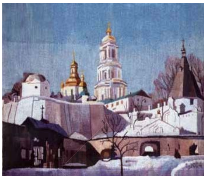
«Зимовий ранок. Вхід до Києво-Печерської лаври». 2004 р.