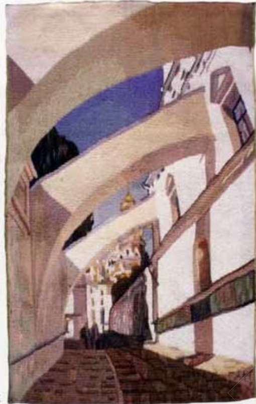
«Лаврські аркбутани». 2004 р.