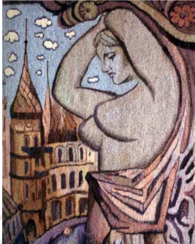
«Ярославів вал, Київ». 2004 р.