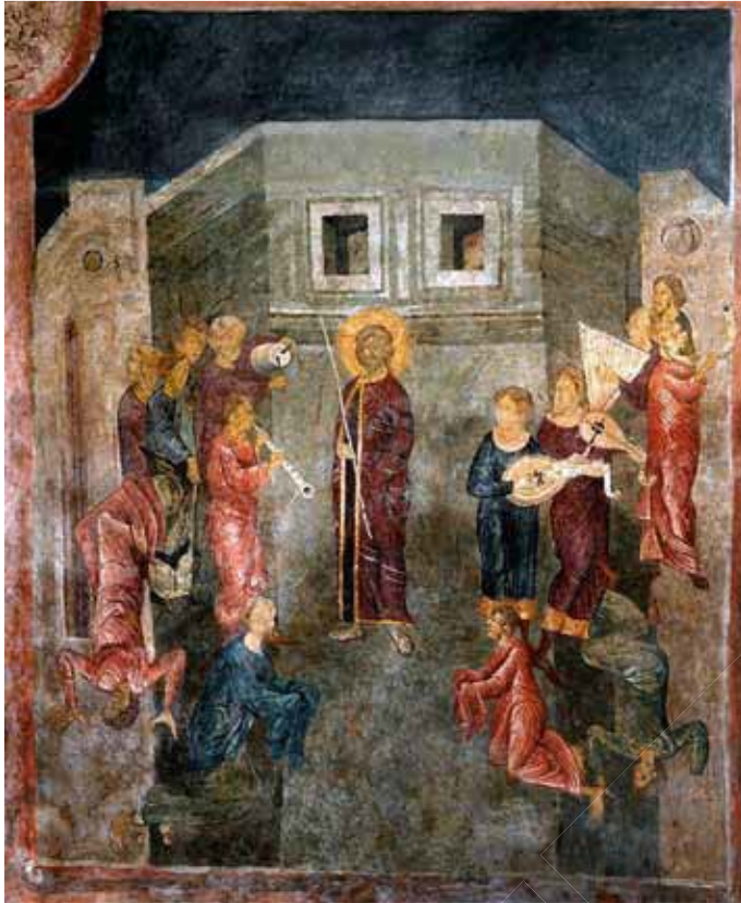
Руські маляри, під керівництвом майстра Андрія. Музиканти, співаки та скоморохи (танцюристи-акробати) короля Владислава II Ягайла (фрагмент фрески «Христос у Преторії». Каплиця Святої Трійці. м. Люблін, Республіка Польща). 1418 р.