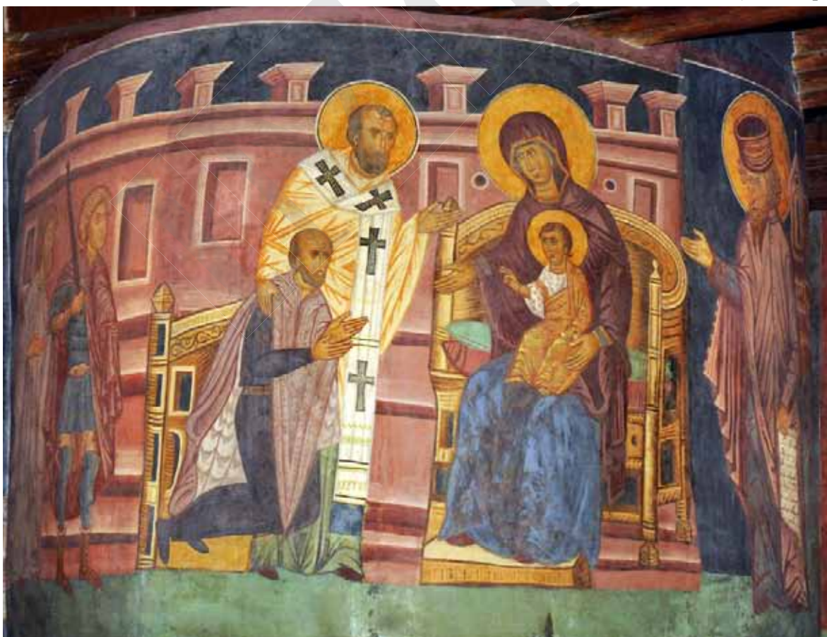
Руські маляри, під керівництвом майстра Андрія. Польський король Владислав II Ягайло на колінах перед Богородицею з Ісусом-Дитям (фрагмент фрески «Христос у Преторії». Каплиця Святої Трійці. м. Люблін, Республіка Польща). 1418 р.