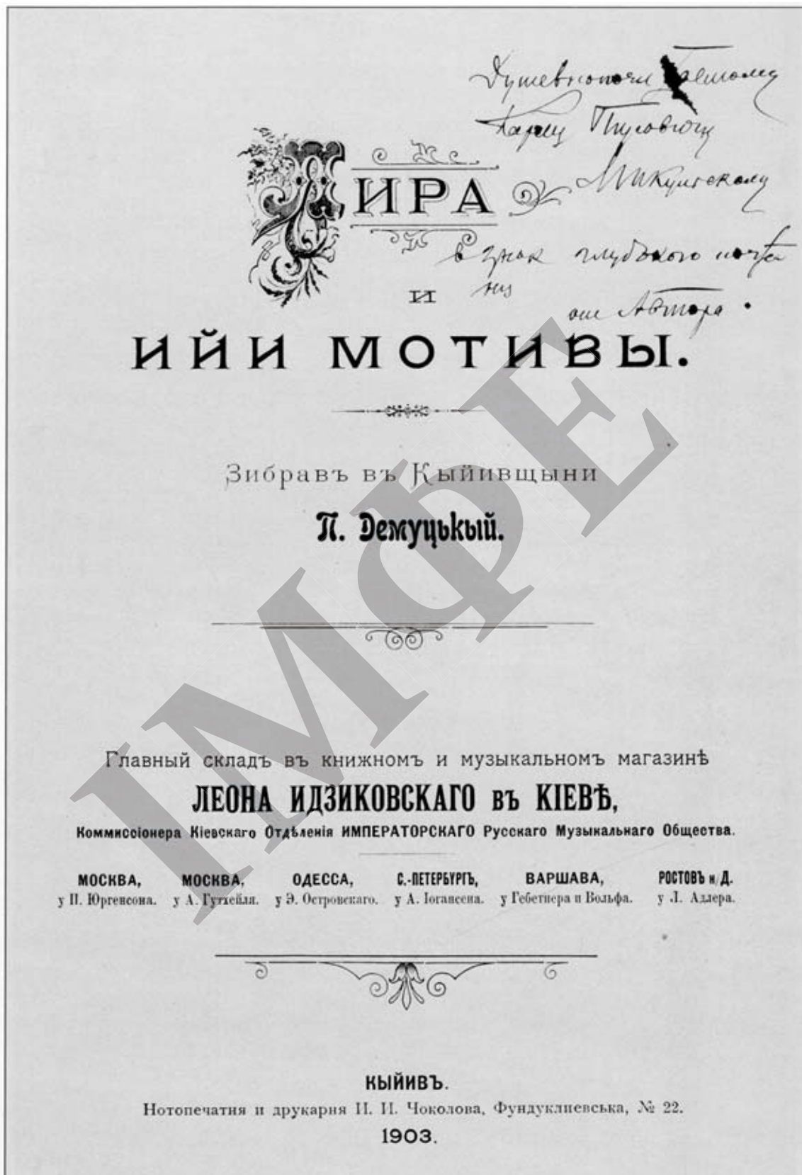
Титульна сторінка книги «Ліра і її мотиви» з дарчим підписом Порфирія Демуцького Карлу Мікульському. м. Київ. 1903 р.