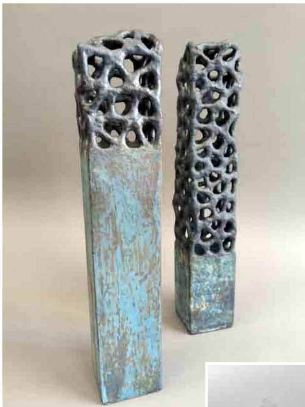
Ю. Мусатов. Вежі I і II. Шамот, кольорові маси, оксид міді. Авторська техніка. 2014 р.