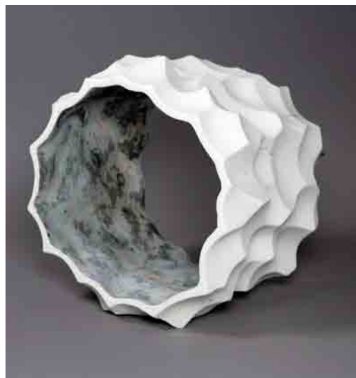
Ю. Мусатов. Периста хмара. Шамот, ангоб, кольорові маси. Авторська техніка. 2014 р.