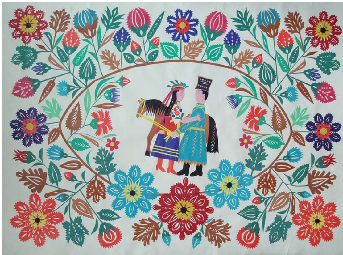
Г. Гречанова. Панно із циклу Катерина. Папір, вирізування. 1987 р. с. Петриківка Дніпропетровської обл. НМНАПУ