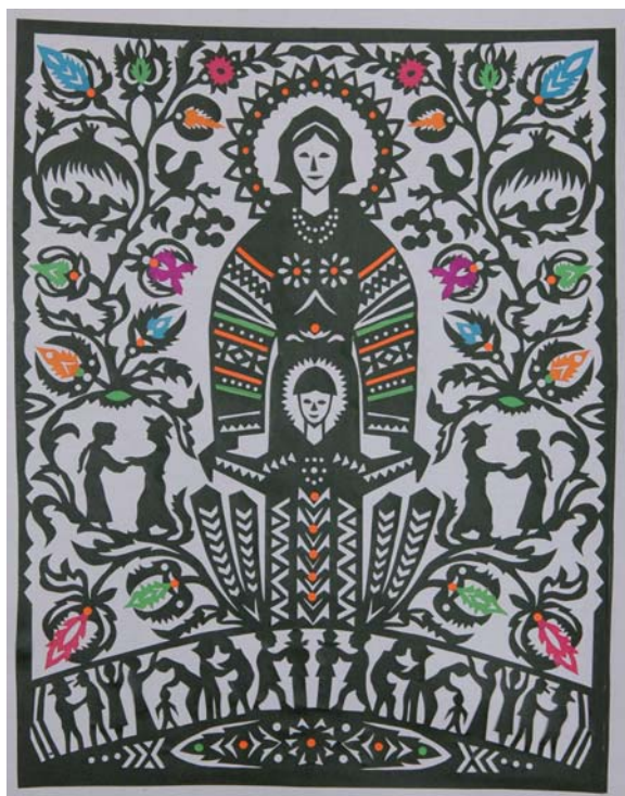
Д. Власійчук. «І буде син, і буде мати...». Папір, вирізування. 2013 р. м. Хмільник. Приватна збірка