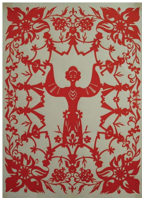
М. Ремінецька. «І будуть люди на землі». Папір, вирізування. 1983 р. м. Тернопіль. МНАПЛ