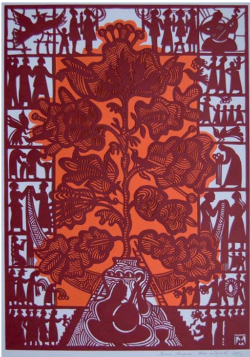
М. Теліженко. Шана Кобзареві. Папір, вирізування. 2009 р. м. Черкаси. Приватна збірка