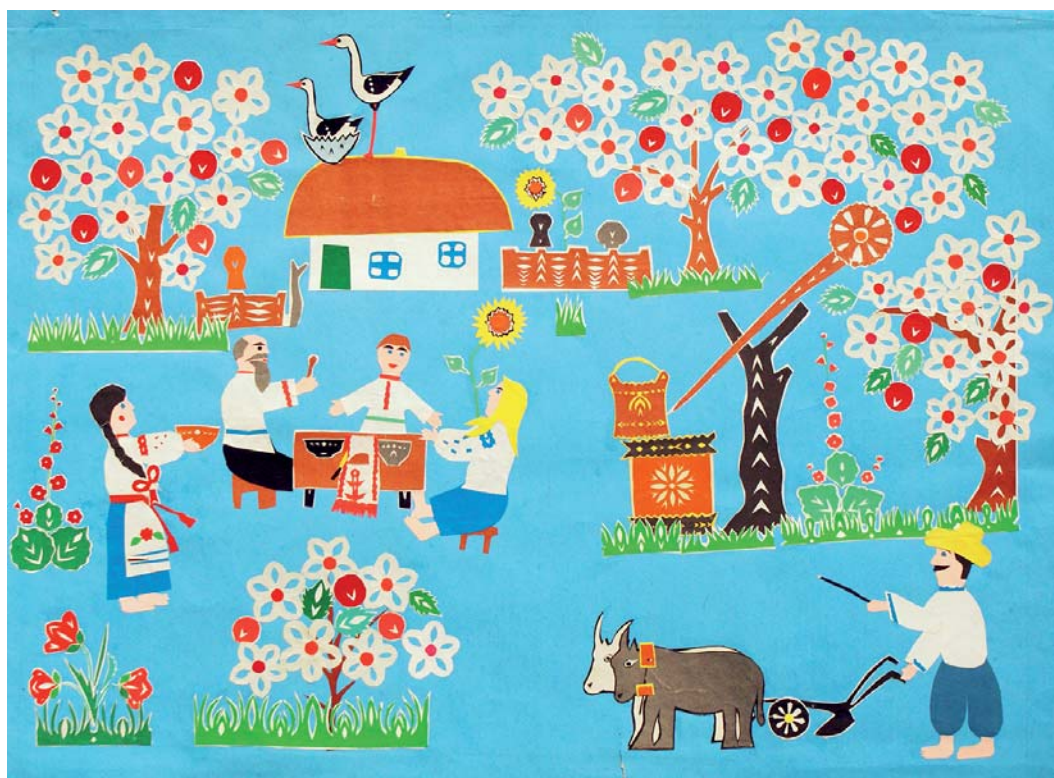
А. Авдієнко. Садок вишневий коло хати. Папір, вирізування. 1989 р. с. Петриківка Дніпропетровської обл. ДНІМ